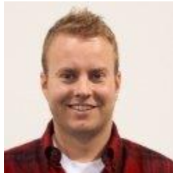
جان رمپتون ۳

من چند کارآفرین می‌شناسم که ازدواج و زندگی مشترک خود را قربانی شرکت و کار خود کرده‌اند که درک دلیل آن آسان است؛ چرا که با چالش‌هایی مانند ساعت‌ها کار زیاد رو به رو هستند. با توجه به اینکه بنیاد کاوفمن ۲ گزارش داد که حدود ۷۱ درصد از همه کارآفرینان ازدواج کرده‌اند، من می‌توانم باور کنم که تعداد زیادی از این کارآفرینان نیز طلاق گرفته‌اند.